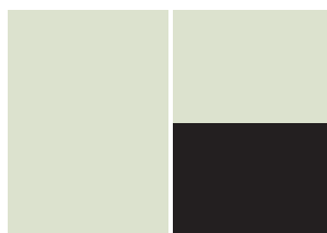
Halvside bred 1/2 Kr. 6.000,- BxH: 258x185 mm