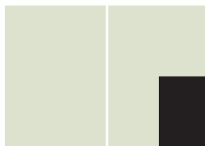
Kvartside 1/4 Kr. 3.500,- BxH: 129x185 mm