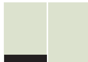
Banner Kr. 2.000,- BxH: 258x25 mm