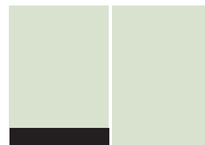
Banner Kr. 2.000,- BxH: 258x25 mm