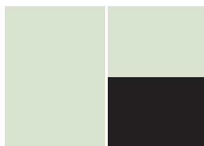
Halvside bred 1/2 Kr. 6.000,- BxH: 258x185 mm