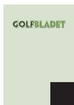
Forside A Kr. 4.000,- BxH: 75x84 mm