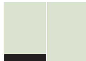
Banner Kr. 2.000,- BxH: 258x25 mm